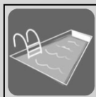
Piscine / Swimming pool

The chalet features DVD players and a home cinema system